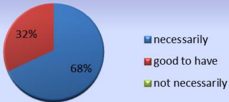
Motivation of students for participation on current courses